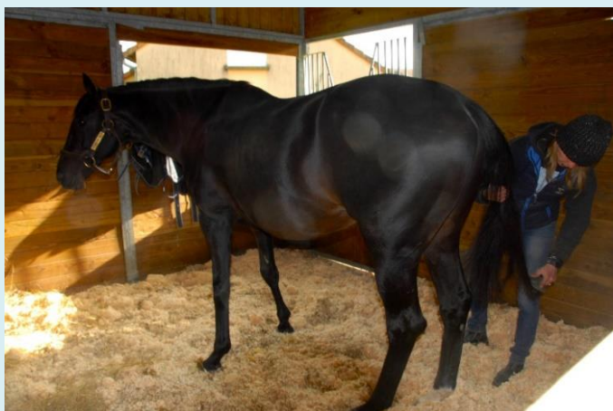
La star Cocoriko au pansage

Quant aux futurs champions, ils peuvent même être préparés à la vente, ou participer à des concours de modèles et allures !