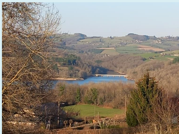
Vue sur le Lac de Pannecièrre-Chaumard depuis les hauteurs du hameau de Vaux (Montigny-en-Morvan)

En attendant la parution du prochain bulletin, n'oubliez pas que vous pouvez consulter le site internet de l'Académie du Morvan qui a été entièrement refondu par notre trésorier et webmaster. Vous avez peut-être également découvert la nouvelle facilité de règlement de votre cotisation en passant par le site « HelloAsso ». Encore merci de penser à la régler en début d'année pour éviter des messages de rappel.