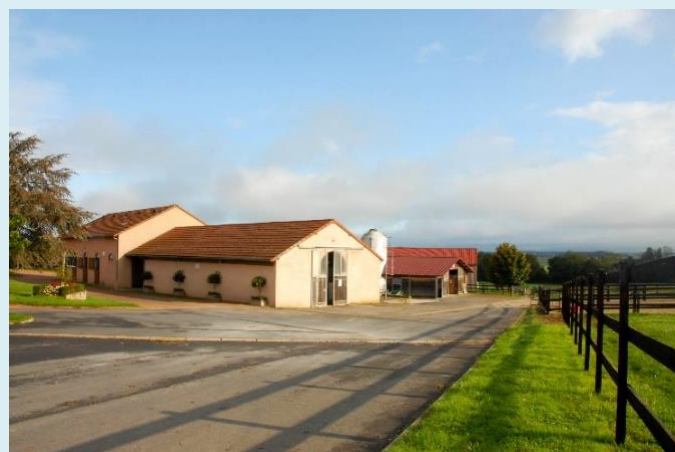
Le haras de Cercy-La-Tour

Comme dans tous les sports, un classement est opéré en fonction des résultats : certains chevaux courent sur des hippodromes de province (groupe 3, dotation 80 000€) comme le prix de la ville de Nice. Ensuite, on trouve des chevaux plus aguerris dans le groupe 2 (dotation 130 000€) dans le Prix du Conseil de Paris. Enfin les champions de niveau mondial s'affrontent dans le groupe 1 (dotation 4,8 millions d'euros) lors du Prix d'Amérique ou le Prix de l'Arc de Triomphe ou du Jockey Club.