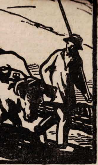
ÉDITÉ PAR LES SYNDICATS D'INITIATIVE DE CLAMECY, SAINT-HONORÉ, NEVERS